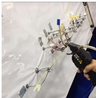
巻き付け→締め付け→切断を 1 ショットで完了