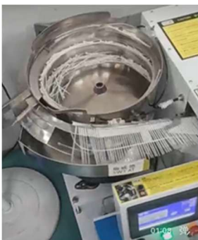
パーツフィーダーによる バンドの自動供給